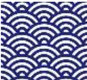
せいがいはい 青海波

文様とは 装飾のためにつけられた図柄。自然物を用いた絵柄や、幾何学的な形を組み合わせたものなど様々なものがある。