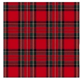
ヨーロッパの文様